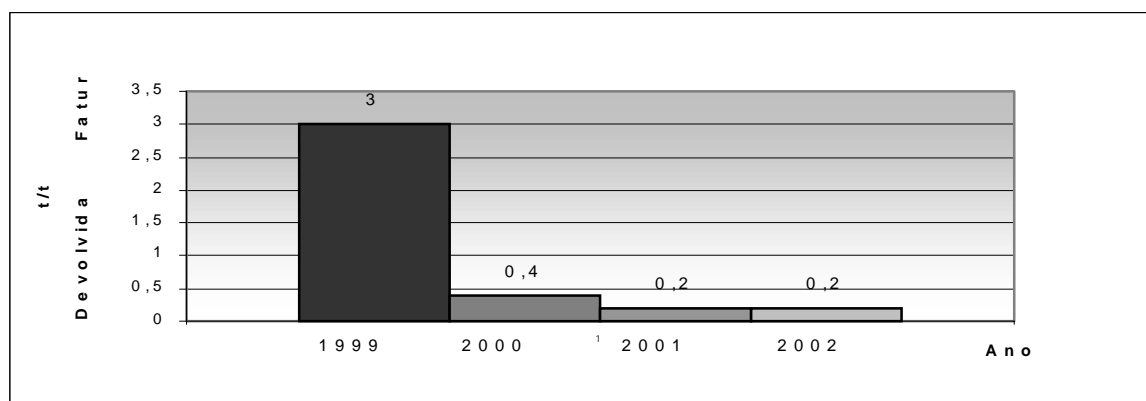
Figura 2 – Devoluções do Projeto Piloto

Analisando a tabela 1, constatou-se que o produto A fabricado na linha Y tem deficiência em produtividade, pois seu padrão de output (indicador de volume de produção por hora) teve de ser reduzido. No período de onze meses, em apenas um mês esteve dentro do valor planejado. Também a meta para o indicador de eficiência de matéria-prima no mesmo período foi atingida em apenas dois meses, da mesma forma o outro indicador de produtividade que é o de tonelada/quebra conseguiu atingir a meta em apenas dois meses.